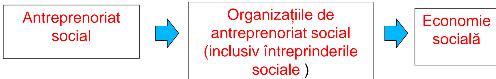
Fig. 1. Relația dintre antreprenoriatul social, organizațiile de antreprenoriat social și economia socială